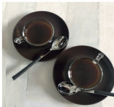
PROGRAMA DE VIVIENDAS COMPARTIDAS ENTRE PERSONAS MAYORES DE 60 AÑOS