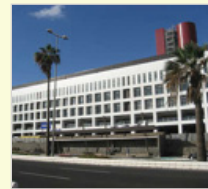
Hospital Insular Las Palmas Gran Canaria