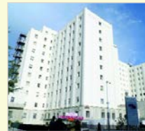
Hospital de Traumatología "Virgen de las Nieves" Granada