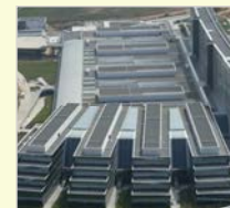
Hospital Universitario Central Asturias