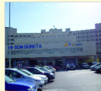
Hospital Son Dureta Palma de Mallorca