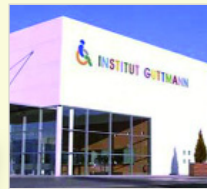
Institut Guttmann Barcelona