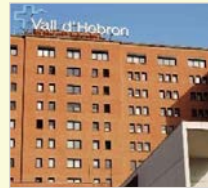
Hospital Vall d'Hebrón Barcelona