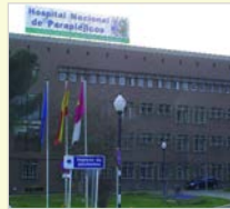
Hospital Nacional Paraplégicos Toledo

o unidades para el Tratamiento de la Lesión Medular dónde se desarrolla ANLM