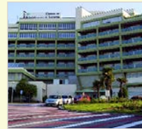
Centro de Recuperación y Rehabilitación Levante Valencia