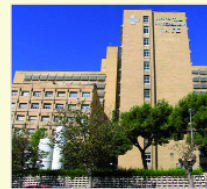
Hospital La Fe Valencia