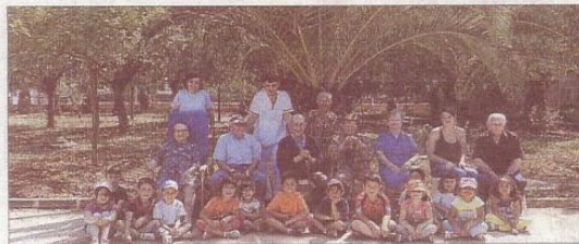
Els alumnes més petits del CEIP Fra Ballester comparteixen moments amb les persones majors de la Residència de la Tercera Edat de Campos.

Els alumnes del Col·legi Fra Joan Ballester de Campos aprenen dels padrins de la vila campanera