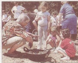
Els infants mostren interès i respecte per tot els que els ensenyen aquestes persones experimentades.