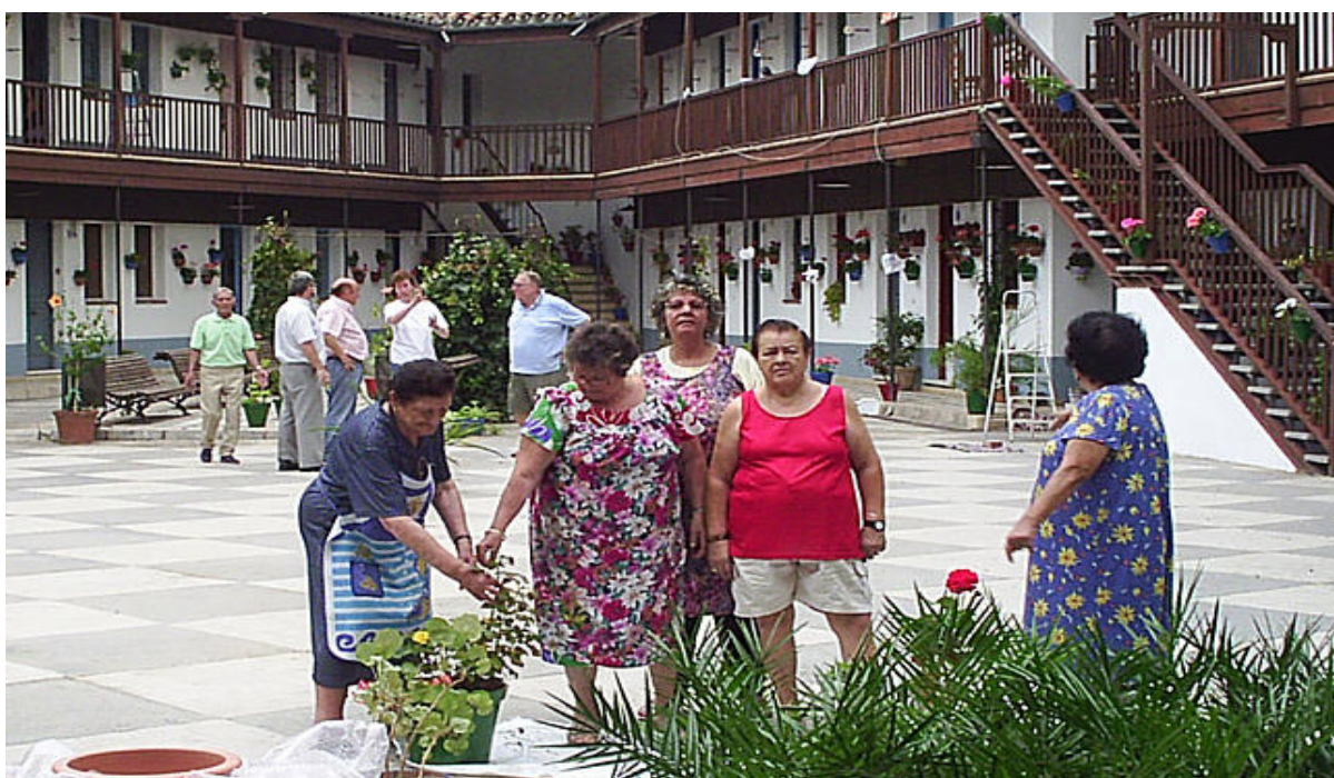
Imagen 07: Cuidado de las macetas en el Corralón de Santa Sofía

Por último, se concede vital importancia a las relaciones sociales que se producen entre los inquilinos del Corralón concientes de que estas resultan básicas para el desarrollo personal y afectivo y para la salud física y psíquica, y de que la actividad social que se realiza fuera de la familia también incide en la calidad de vida de las personas mayores, facilitando su socialización. De ahí, la importancia de este espacio que permite a este grupo de personas un lugar de integración donde pueden participar activamente de la vida social y vecinal.