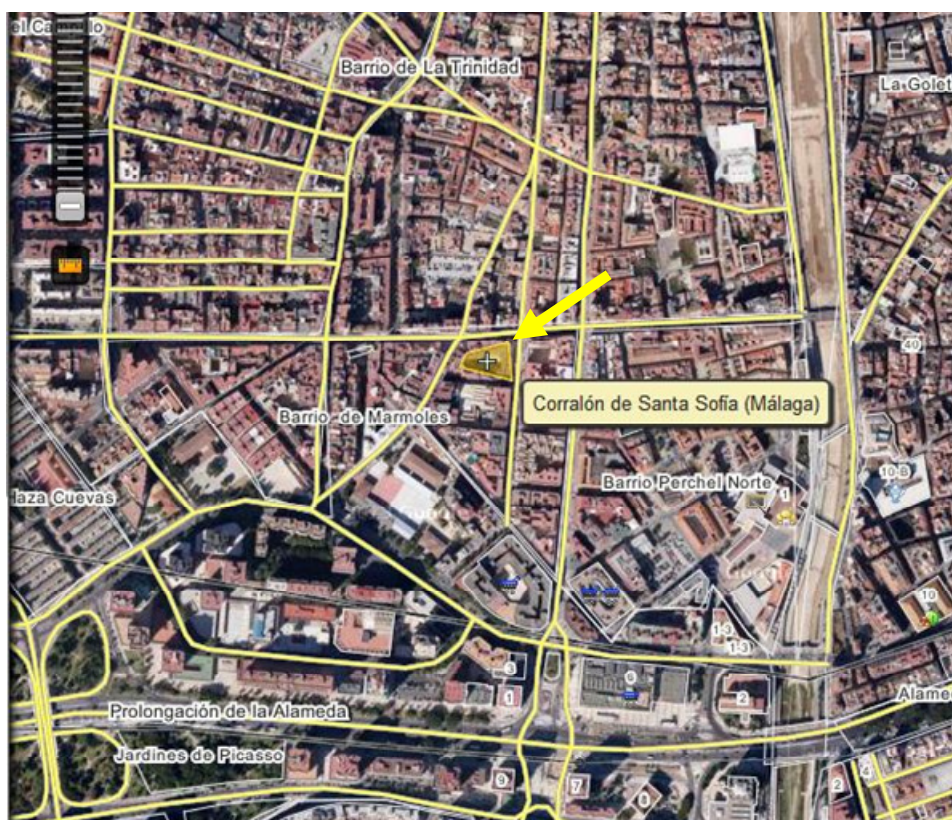
Imagen 01: Ubicación del Corralón de Santa Sofía entre las barriadas del Perchel y la Trinidad (Málaga)

Los ejemplos más destacados de estos corralones se encuentran en las barriadas de La Trinidad y El Perchel, donde hay censados actualmente 106 corralones. Algunos de ellos de reciente construcción tras la remodelación llevada a cabo a través del Plan Especial de Rehabilitación Integral de Trinidad y Perchel, manteniendo la tipología social y urbanística, propias de estas barriadas, pero dotándolos de un confort, acorde a los tiempos, recursos y servicios actuales.