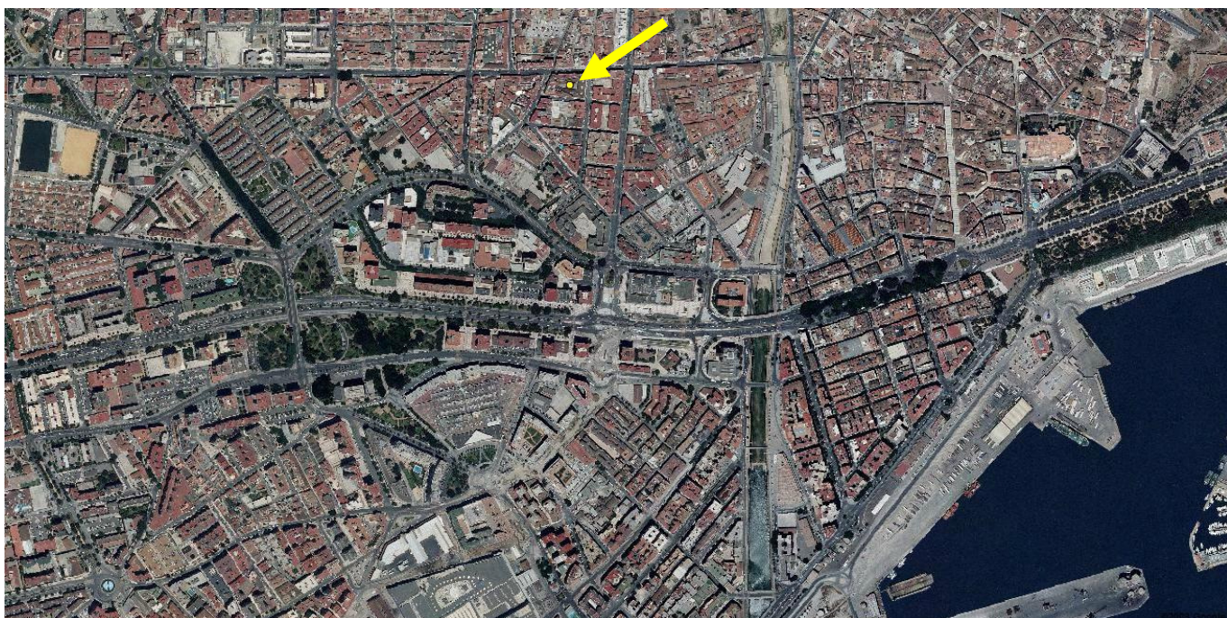
Imagen 04: Vista aérea de la ciudad de Málaga y ubicación del Corralón de Santa Sofía

Una de las características peculiares de estos inmuebles son sus reducidas dimensiones, el tamaño de las viviendas actuales resulta suficiente para albergar apartamentos de 1 ó 2 camas con amplia estancia, cocina y servicios, pero lejos de ser un inconveniente, suponen una ventaja dado que facilitan a los inquilinos su limpieza, y conforman un hábitat recogido, y fácil de mantener y aclimatar.