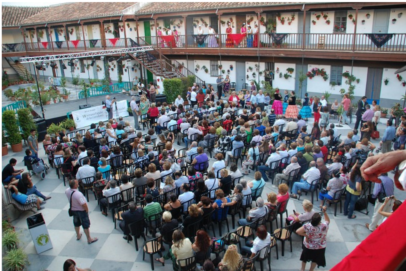
Imagen 11: Celebración de la III Bienal de Arte Flamenco de Málaga en el Corralón de Santa Sofía, durante la IX Semana Popular de los Corralones

La Semana de los Corralones incluye un Concurso de Patios, Calles y Balcones, y Rutas por los barrios de Trinidad y Perchel, que es la actividad Central.