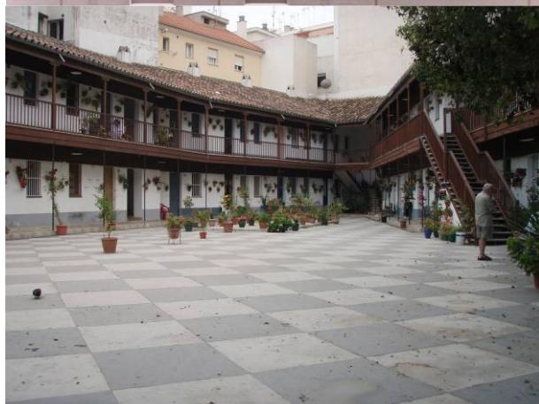
Grupo de imágenes: Rehabilitación Corralón.

La disposición de los volúmenes y el tipo de unidades residenciales que conforman los lados del patio interior permiten un conjunto residencial que además posibilita el uso del colectivo vecinal para determinados servicios colectivos como son los talleres, los espacios destinados a