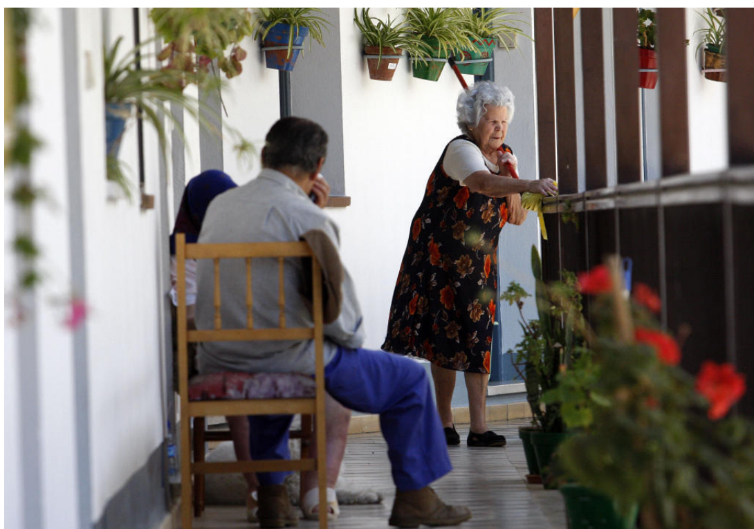
Imagen 08: Convivencia en el Corralón de Santa Sofía

Tal y como se ha descrito, los corralones con sus patios, de forma cuadrada o rectangular, eran lugares donde se vivía como “una pequeña gran familia” con un clima adecuado de convivencia. Era un espacio de comunicación y participación social, donde se desarrollaba un clima de convivencia y desarrollo de la vecindad.