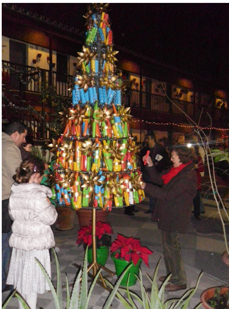
Imagen 12: Navidad en los Corralones. Árbol de los Deseos en el Corralón de Santa Sofía.

La Navidad en los Corralones es una iniciativa de los servicios sociales del Distrito Centro, a través de la que se promueve un concurso de ornamentación navideña en los patios de los corralones de vecinos, aderezado con diversas actividades propias de estas fiestas.