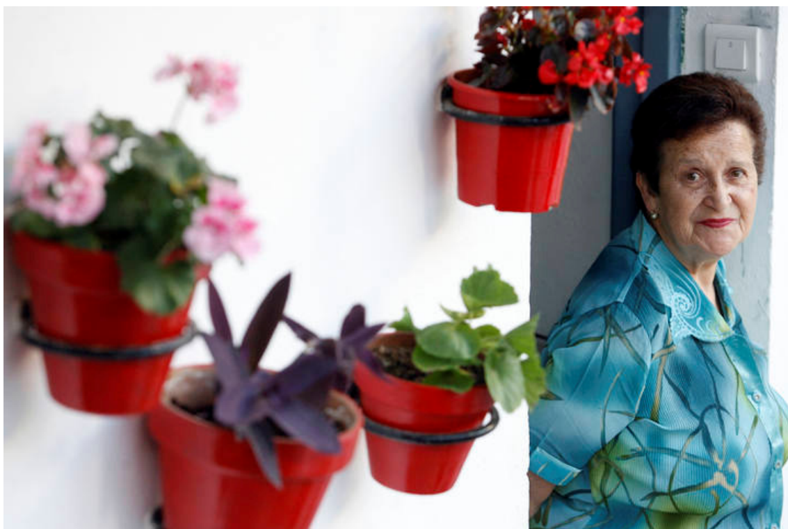
Imagen 03: Vecina del Corralón de Santa Sofía.

Los corralones son un tipo de construcción que alcanzó su punto álgido en Málaga en el siglo XIX con la llegada de numerosos trabajadores del campo a la capital con motivo de la Revolución Industrial. Los corralones tradicionales de Málaga fueron una seña de identidad urbanística, de espacio comunitario, en el que convivían familias modestas. La escasez de recursos se sobrellevaba con la solidaridad entre semejantes que se practicaba a diario. Las viviendas no tenían más de una o dos habitaciones y la cocinita se abría al pasillo. Había un baño común para todo el vecindario en el patio central, donde habitualmente también se encontraban las pilas de lavar.