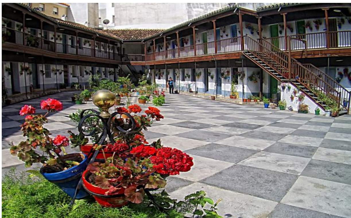
Imagen 05: Patio central del Corralón de Santa Sofía (imagen tomada por Toni Molero y publicada en la Web del Diario Sur).

El solar de forma sensiblemente triangular se comunica con la calle a través de un pasaje que acomete prácticamente a eje sobre la única fachada. Se trata de un volumen de dos plantas que además de las viviendas sociales recoge un buen número de usos colectivos abiertos a la barriada situados mayoritariamente en las crujías de fachada, como son biblioteca y salón de usos múltiples, talleres, cocina y comedor, sala de reuniones y lavadero. Se perpetúa de este modo el tipo de corralón en el que las viviendas se adosan a las medianeras de la parcela, accediéndose a las mismas a través de la tradicional galería en ambas plantas que se sustenta mediante delgados perfiles metálicos en la planta baja y mediante pies derechos de madera en la siguiente. Sobre ésta se formaliza una tradicional cubierta de teja con el vierteaguas hacia el patio, sobre la que se recortan en la actualidad los bloques vecinos.