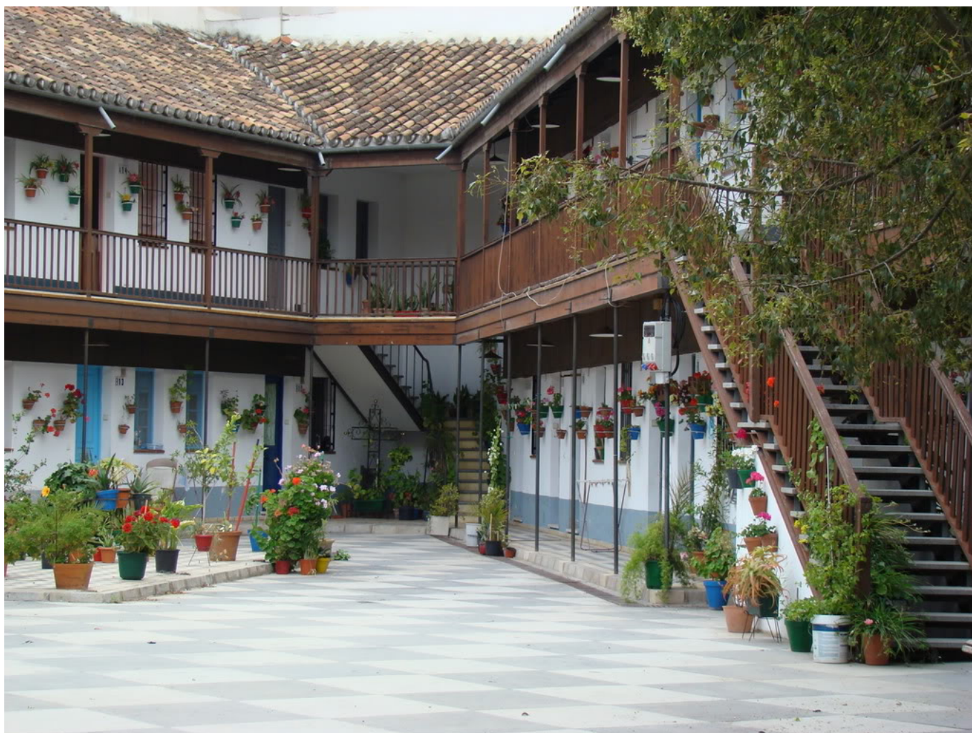
Imagen 02: Corralón de Santa Sofía

Situado en la calle Montes de Oca, esquina con Estébanez Calderón, al cruzar el umbral del Corralón de Santa Sofía aparece un patio abierto, con balaustradas de madera y con macetas en cada casa que adornan las puertas y ventanas de sus dos alturas.