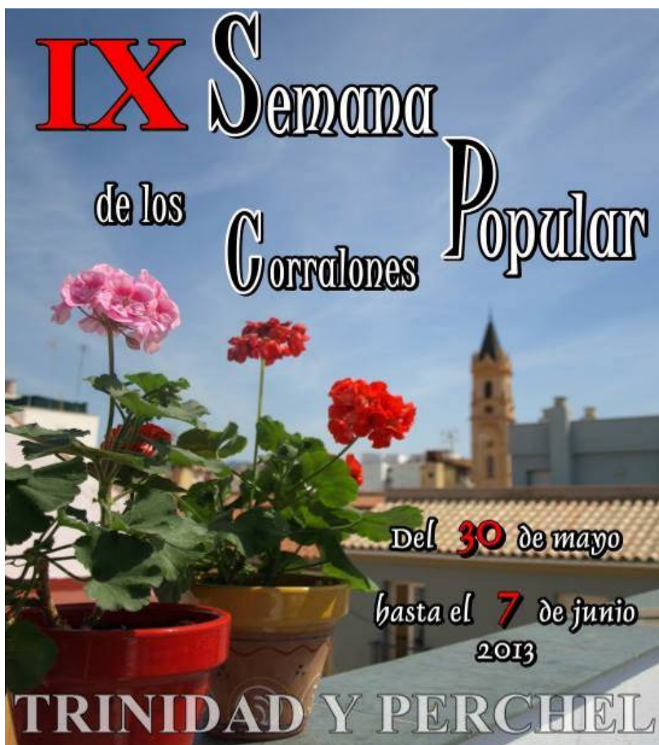
Imagen 09: Cartel de la IX Semana Popular de los Corralones

Se organiza en torno a una serie de jornadas para mejorar la autoestima de los vecinos de las barriadas de Trinidad y Perchel y su implicación en el cuidado y fomento de un entorno más atractivo con el fin de promocionar estos dos barrios como parte del Centro Histórico de la Ciudad a los ojos de curiosos y visitantes.