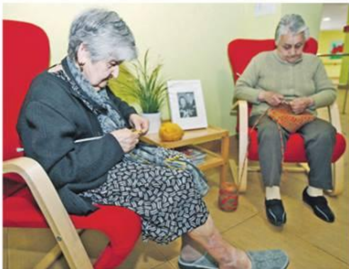
En sus centros de día, Saraiva propone espacios donde primen detalles personales y familiares. CAPOTILLO

Todas estas experiencias y servicios se añaden en el proyecto global Saraiva Senior, que acaba de convertirse en uno de los diez seleccionados a nivel nacional en el prestigioso concurso de emprendedores so-