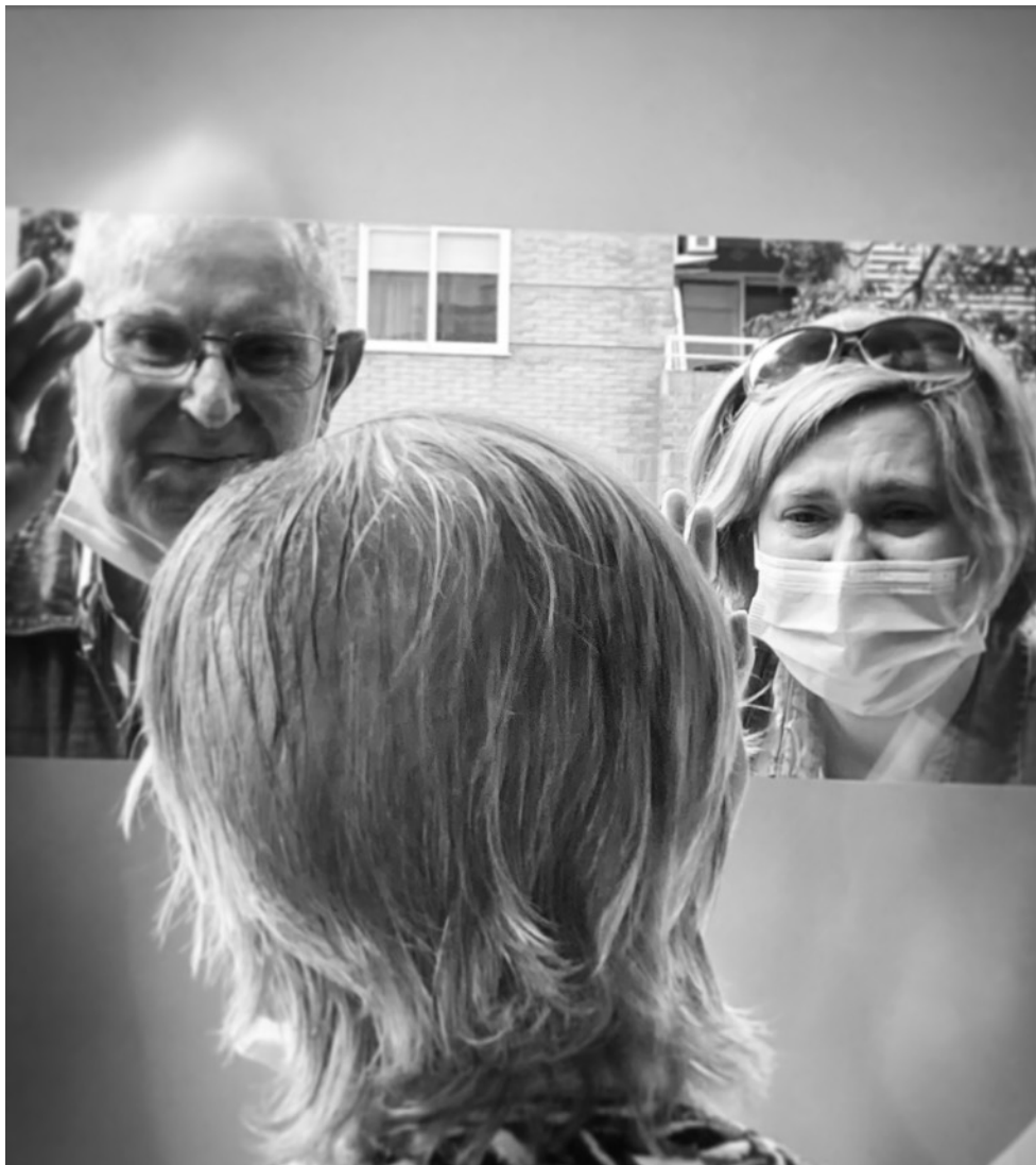
Dia 53 Miradas a traves del cristal.