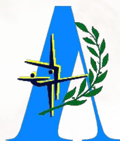
COLEF ASTURIAS Colegio Oficial de Licenciados en Educación Física y Ciencias de la Actividad Física y Deporte (COLEF)