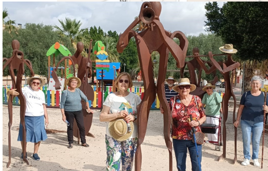
PLAZA DE LA MÚSICA