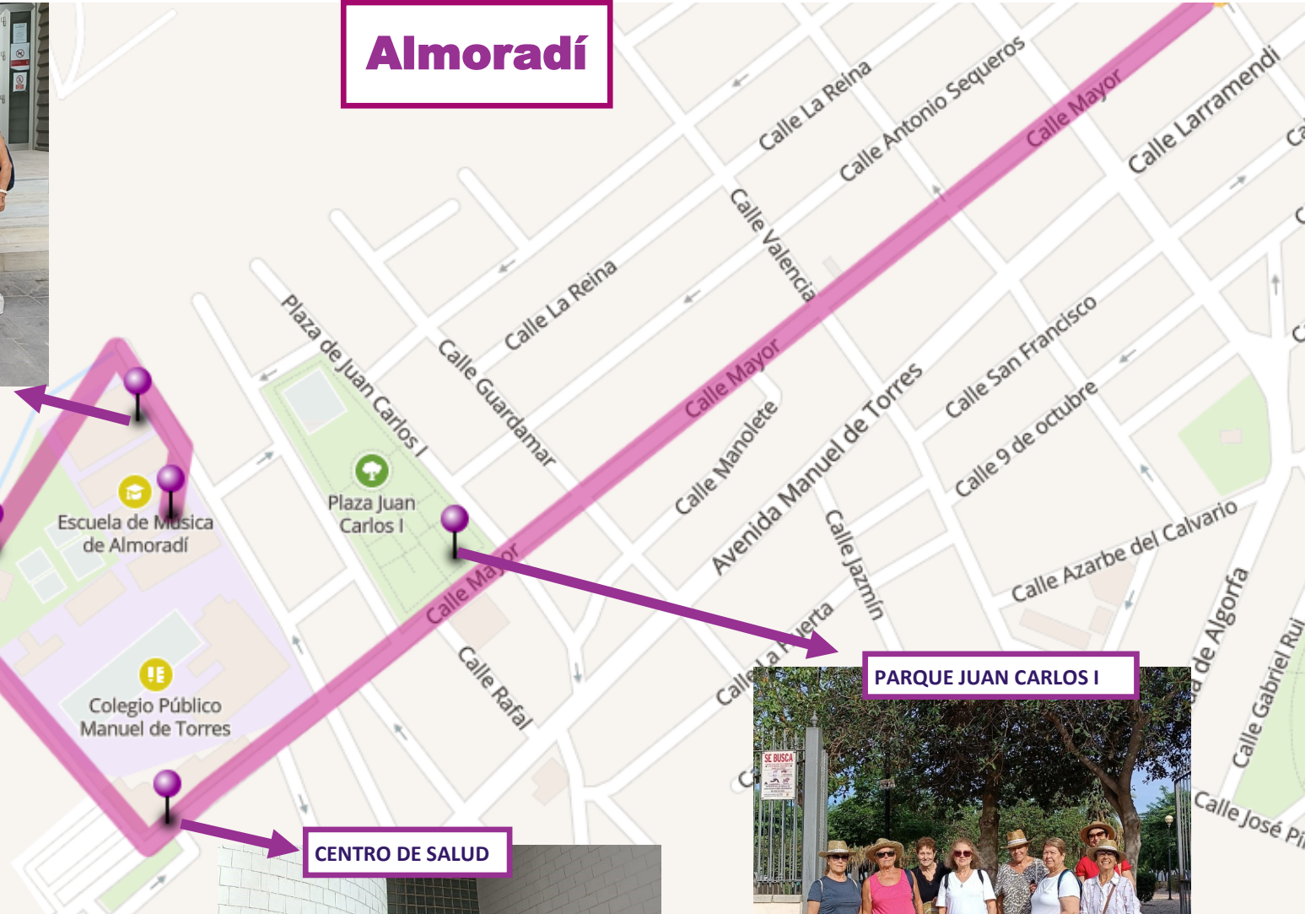
CENTRO DE SALUD