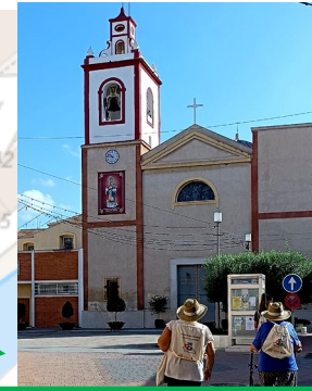
IGLESIA SAN PEDRO ASPÓSTOL