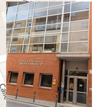
BIBLIOTECA "MIGUEL ORTEGA"