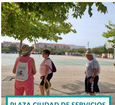
PLAZA CIUDAD DE SERVICIOS