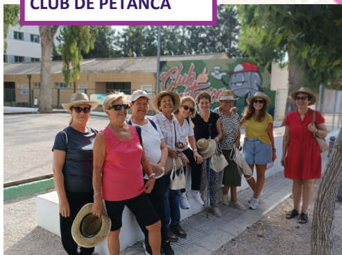
CLUB DE PETANCA