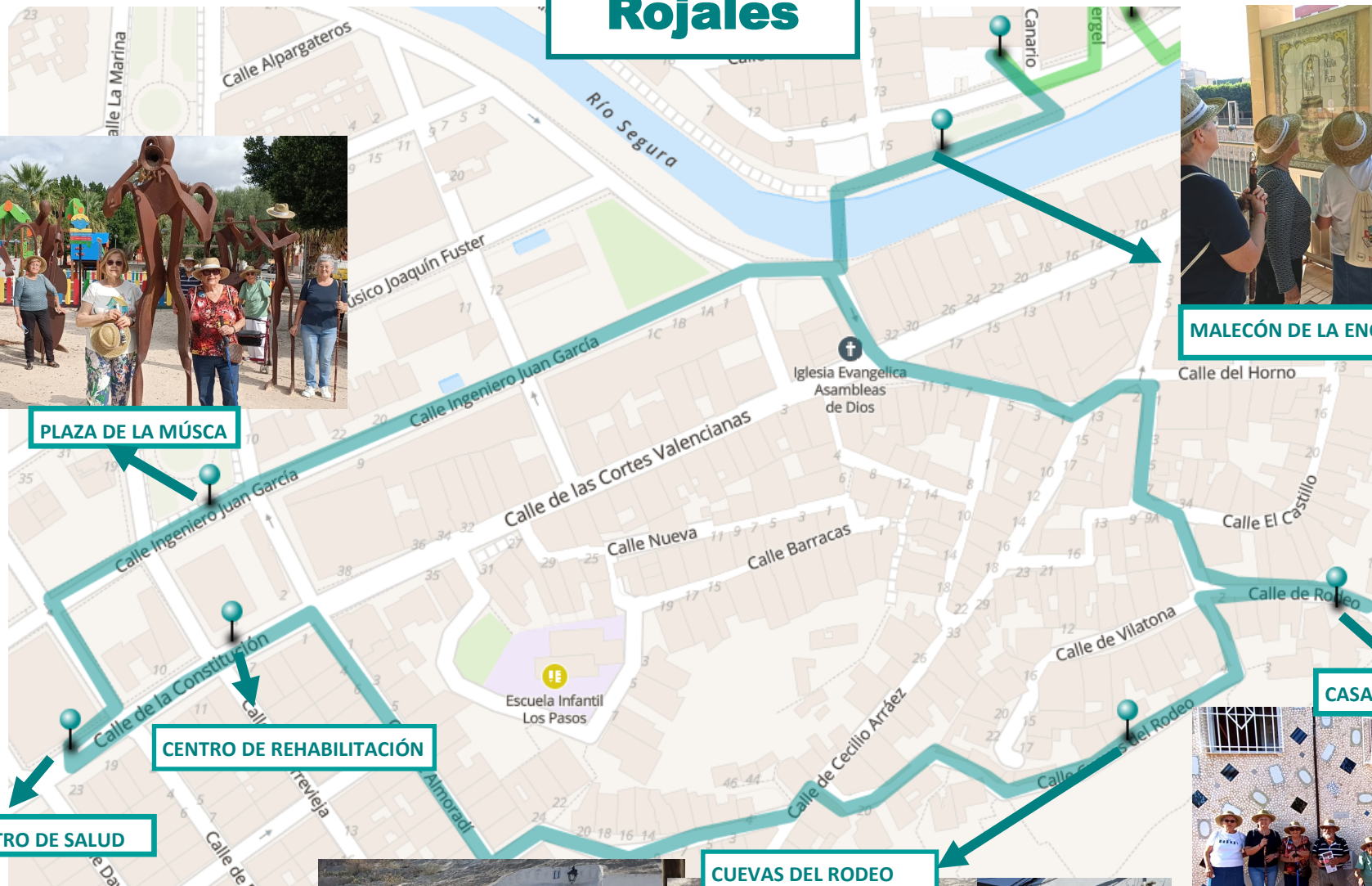
CENTRO DE REHABILITACIÓN