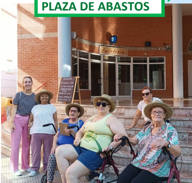
PLAZA DE ABASTOS