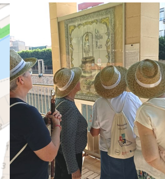
MALECÓN DE LA ENCANTÁ