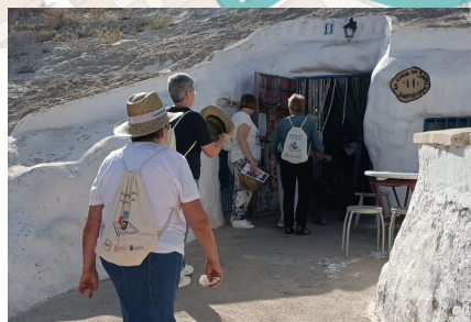
CUEVAS DEL RODEO