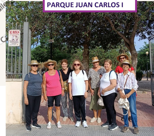
PARQUE JUAN CARLOS I