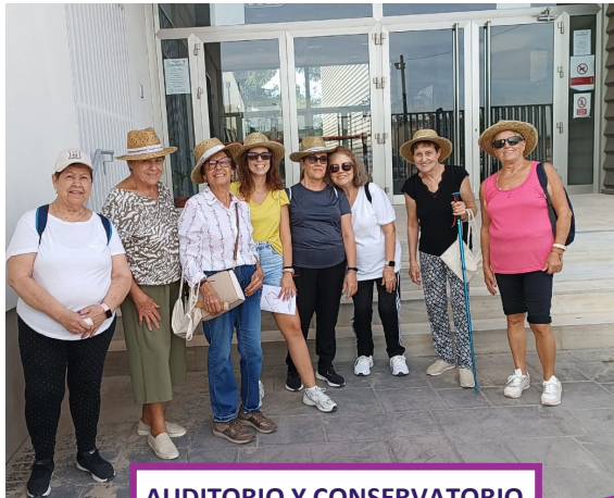
AUDITORIO Y CONSERVATORIO